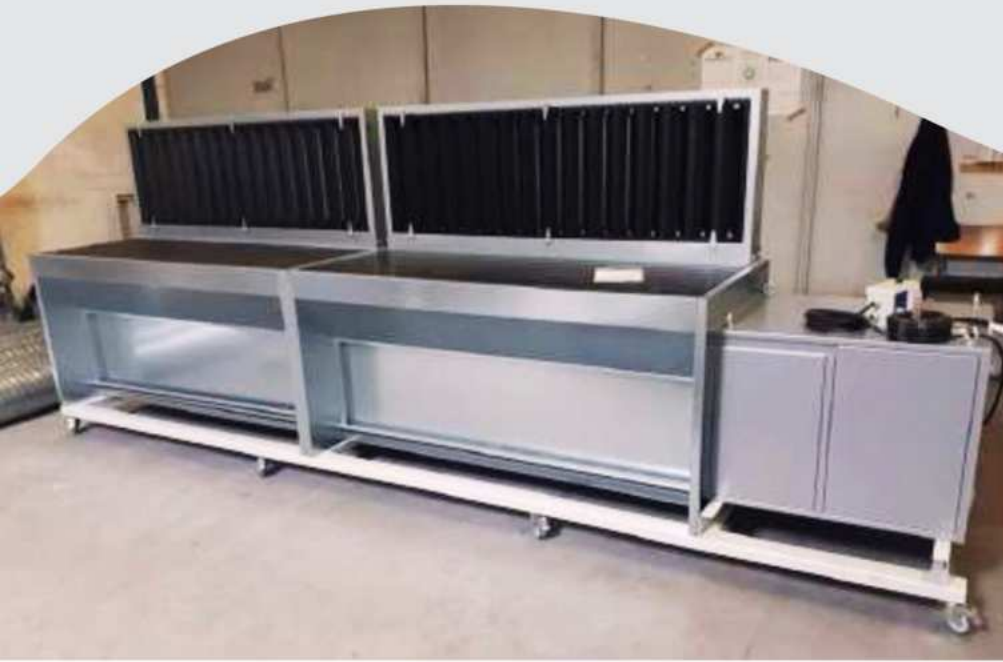
WA-1800/2700/3900/4800 Absauganlage mit Watron- Absaugtisch