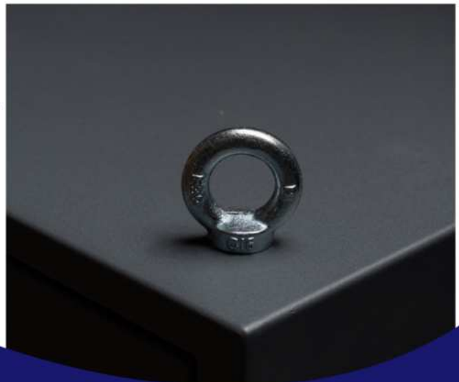
WA-1800/2700/3900/4800 hängend an der Decke oder Wand mit externem Regler und 10 m Kabel