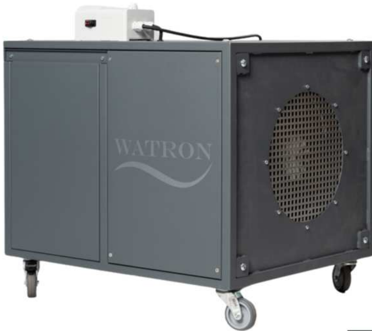
Hallenabsaugung mobil auf Rollen mit Regler am Gerät